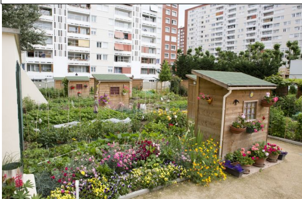
Exemple de jardins partagés urbains :