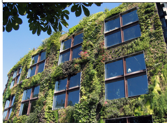
Exemple de mur végétal :