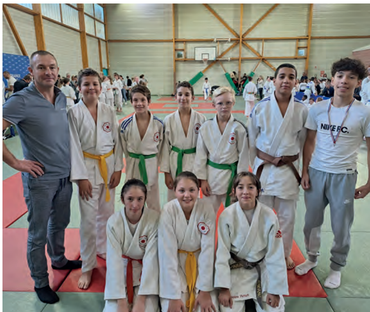
Les minimes à Attiches