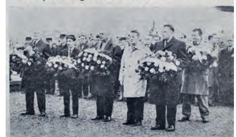
Au cimetière du Sud, les personnalités s'apprêtent à déposer les gerbes au caveau-souvenir.