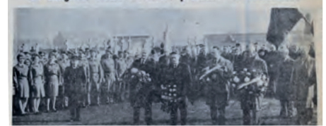
A ANICHE : messe en l'église Saint-Martin et dépôts de gerbes aux monuments aux morts