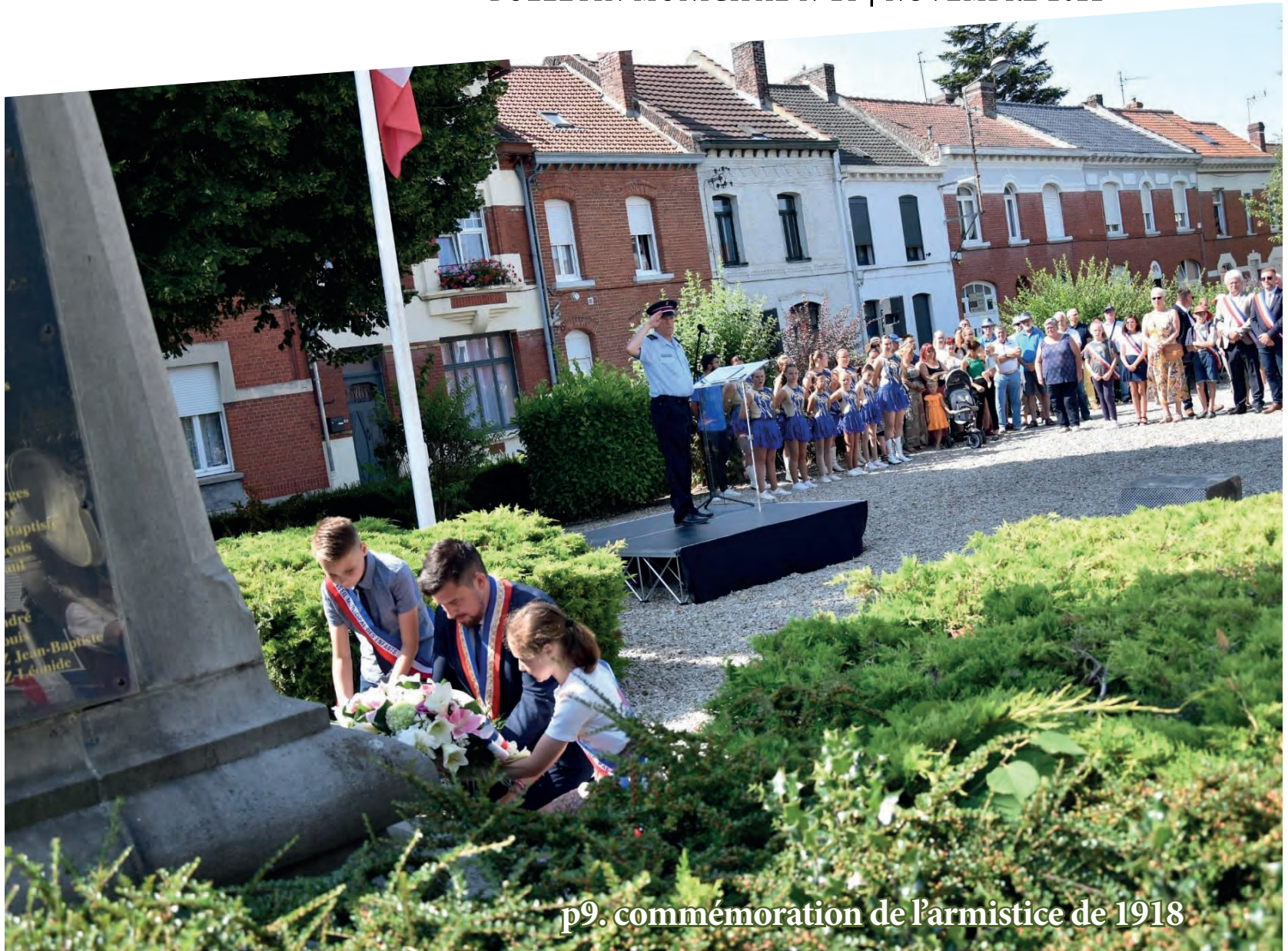
p9. commémoration de l'armistice de 1918