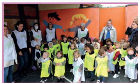
p11. Petite enfance

Les écoliers de Cachin formés à l'écocitoyenneté !